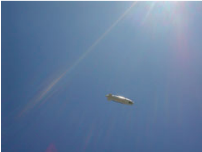
Kuva 1 Kuvassa käytetään Kuva-tyyliä. Kuvateksti tulee kuvan alle.

Sed semper pulvinar pede. Mauris quis augue. Nunc euismod dictum lectus. Quisque eu nibh non nunc mattis fermentum. Aliquam erat volutpat. Proin vestibulum nisl sit amet mi. Phasellus urna erat, molestie ut, pharetra eget, iaculis nec, eros.